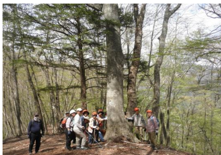
【奥秩父巨木探訪(ミズナラ編)】