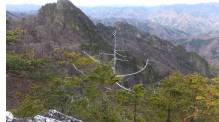
【奥秩父連峰の眺望を楽しむ赤岩峠登山】