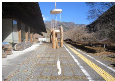
【間伐体験と木製風鈴作り】