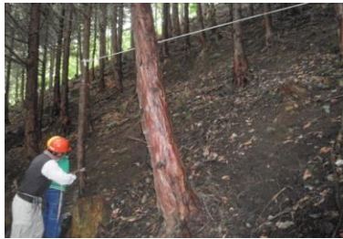
【間伐体験と木製風鈴作り】