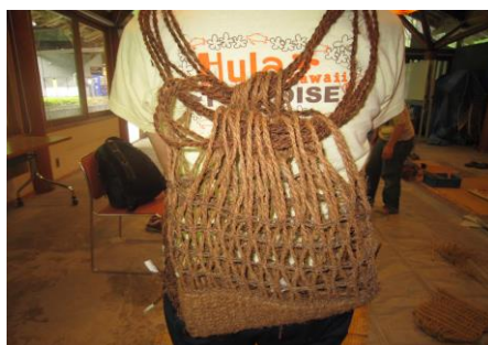
【すかり作り(背負い編み袋)】