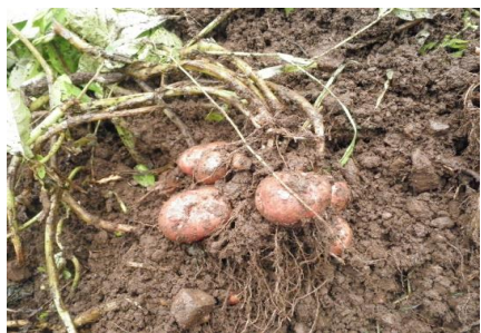
【中津芋栽培体験(収穫)】