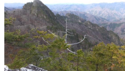
【奥秩父連峰の眺望を楽しむ赤岩峠登山】