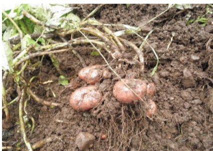
【中津芋栽培体験(収穫)】