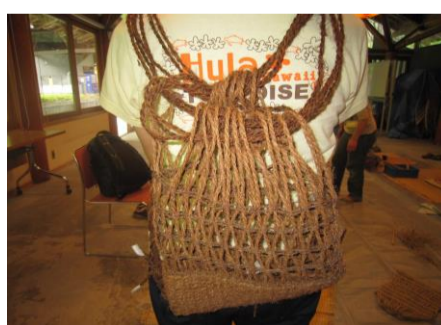
【すかり作り(背負い編み袋)】