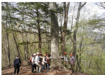
【奥秩父巨木探訪(ミズナラ編)】