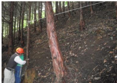
【間伐体験と木製風鈴作り】