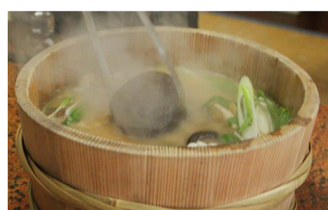
【アウトドア料理in中津】

※ イベント名及び日程・内容等が変更になる場合がありますので、事前にホームページでご確認ください。 ※ 開催前月の1日 午前9時からホームページ申込みフォームにて、参加受付を行っております。 お申込順で定員になりしだい受付を終了致します。