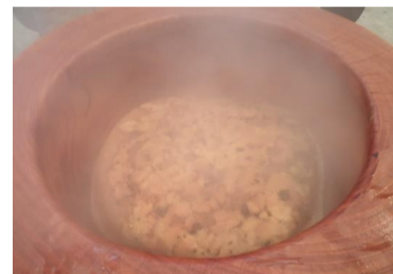
【昔ながらの栃餅作り体験(餅つき)】