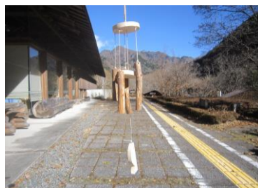
【間伐体験と木製風鈴作り】