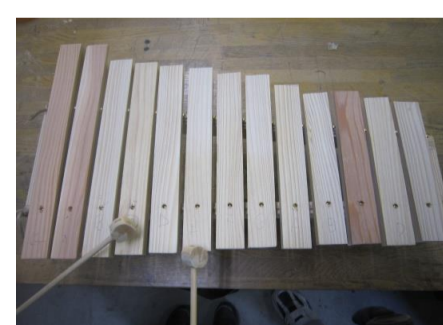
【木琴を作ろう(音階の調整します)】