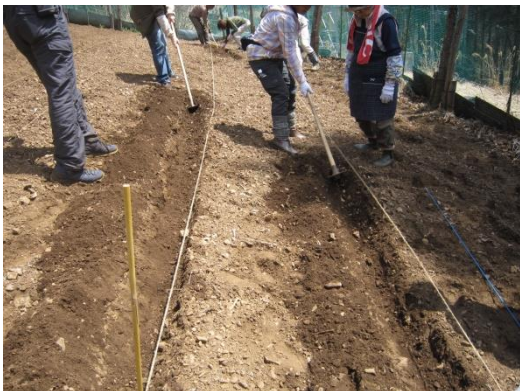
【自分が植える場所を掘る様子】

4月15日(日)植付編と、7月8日(日)収穫編の全2回となります。なお、収穫時には、1組当たり約5kgの生いもをお持ち帰り頂けます。あなたも、秘境の作物「中津川いも」の栽培にチャレンジして、是非、その味をご賞味ください。