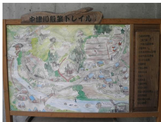
〔平賀源内居跡(中津川散策トレイル参照)〕