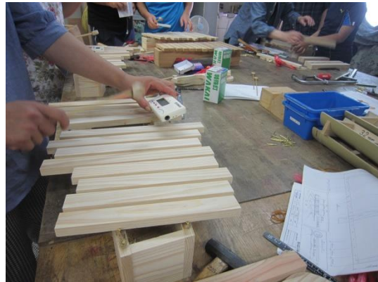
【以外と難しい音階の調整】