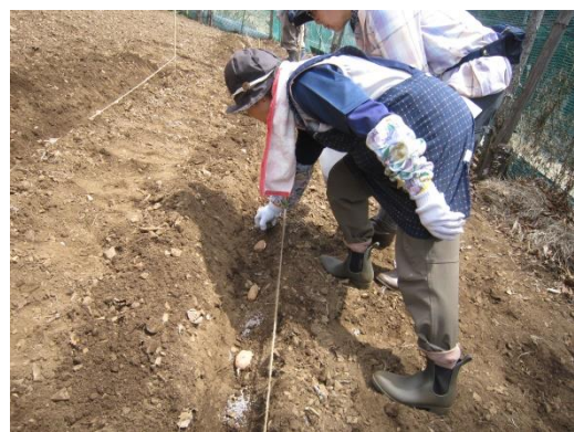
【等間隔で種芋を置いていく】