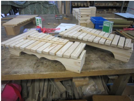
【オリジナルの木琴(もっきん)完成】