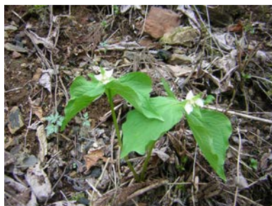
シロバナエンレイソウ