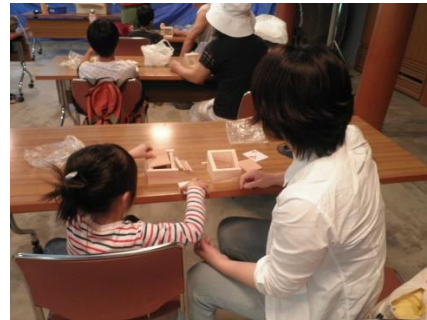
【川原での『鉦物さがし』・標本作り】