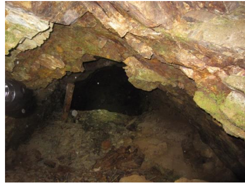
【山のトレッキングの先には『昔の坑道跡』発見】