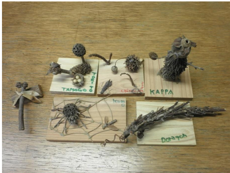
【オリジナルの作品】

なお、8月11日(土)から8月15日(水)までの5日間のみ開催しており、期間限定のイベントですので、是非一度、ご参加ください。