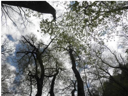
[巨木と昨年度のトレッキング参加者の様子]