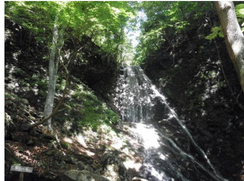
〔道中で観れる法印ノ滝〕