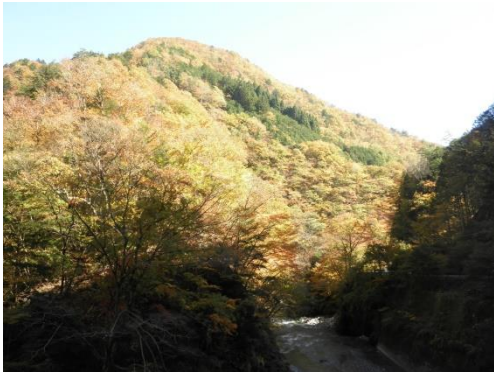
【紅葉風景：相原橋付近】