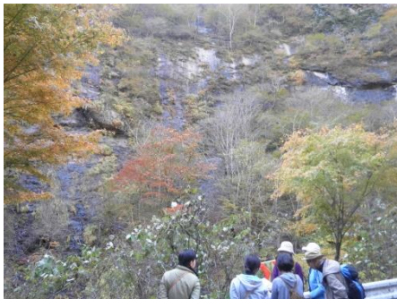
【地元ガイドの案内により、紅葉を楽しむ参加者】