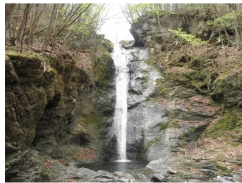
【道中で観れる金蔵沢の滝】