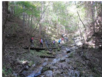
〔南天山沢コースの登山状況(中級者向け)〕