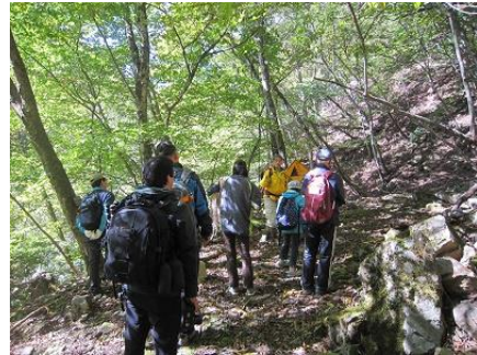
【地元ガイドの説明によるトレッキング状況(初級者向け)】