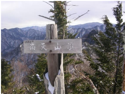
〔南天山山頂からの眺望〕

なお、ご参加頂いた方には、埼玉県森林科学館で作製した「木製キーホルダー」をプレゼントします。