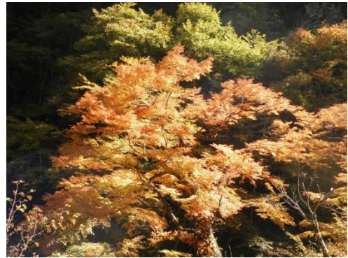
【紅葉スポット(女郎紅葉)】