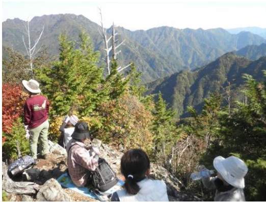
[南天山山頂からの眺望]

なお、ご参加頂いた方には、埼玉県森林科学館で作製した「木製キーホルダー」をプレゼントします。