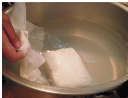
【出来上がった木綿豆腐】