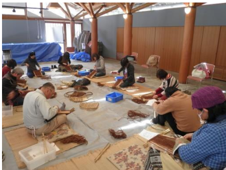
【オリジナルな「ナップサック作り」時間を忘れ集中しています。】