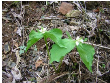
シロバナエンレイソウ